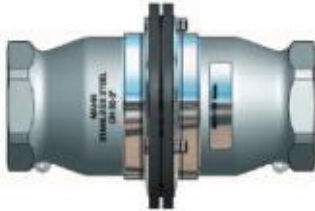
BSP Innengewinde / BSP Innengewinde