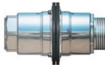
Innengewinde / Außengewinde (BSP oder NPT)