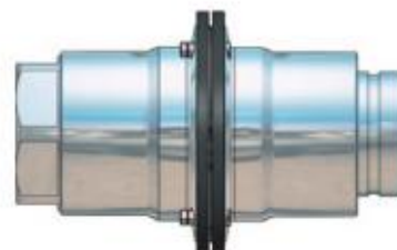
Innengewinde / Victaulic®