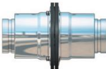
Victaulic® / Victaulic® (Rohrmutstutzen-Anschluss)