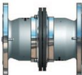
Flansch / Flansch