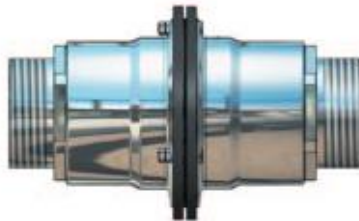
Außengewinde / Außengewinde (BSP oder NPT)